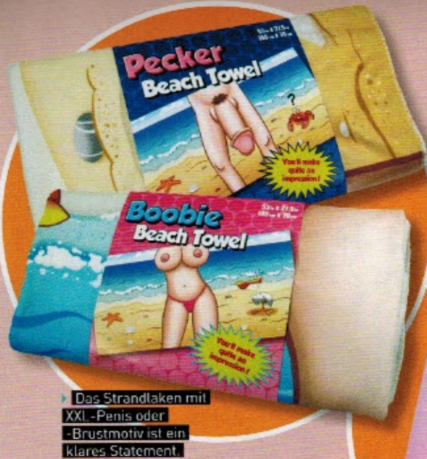
Das Strandlaken mit XXL-Penis oder -Brustmotiv ist ein klares Statement.