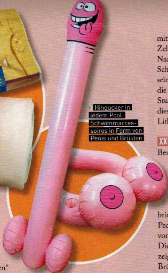
Hingucker in jedem Pool: Schwimmmacchises in Form von Penis und Brüsten

mit ebendiesem Namen vorgestellt. Zehn Vibrationsmodi bietet diese Nachbildung einer Vanilleeiswaffel mit Schokosoße. Sie soll zudem wasserdicht sein. I Scream ist übrigens vermutlich die einzige Eiswaffel, die sich vier Stunden lang genießen lässt. Erst nach dieser Benutzungszeit ist der eingebaute Lithium-Polymer-Akku leer.